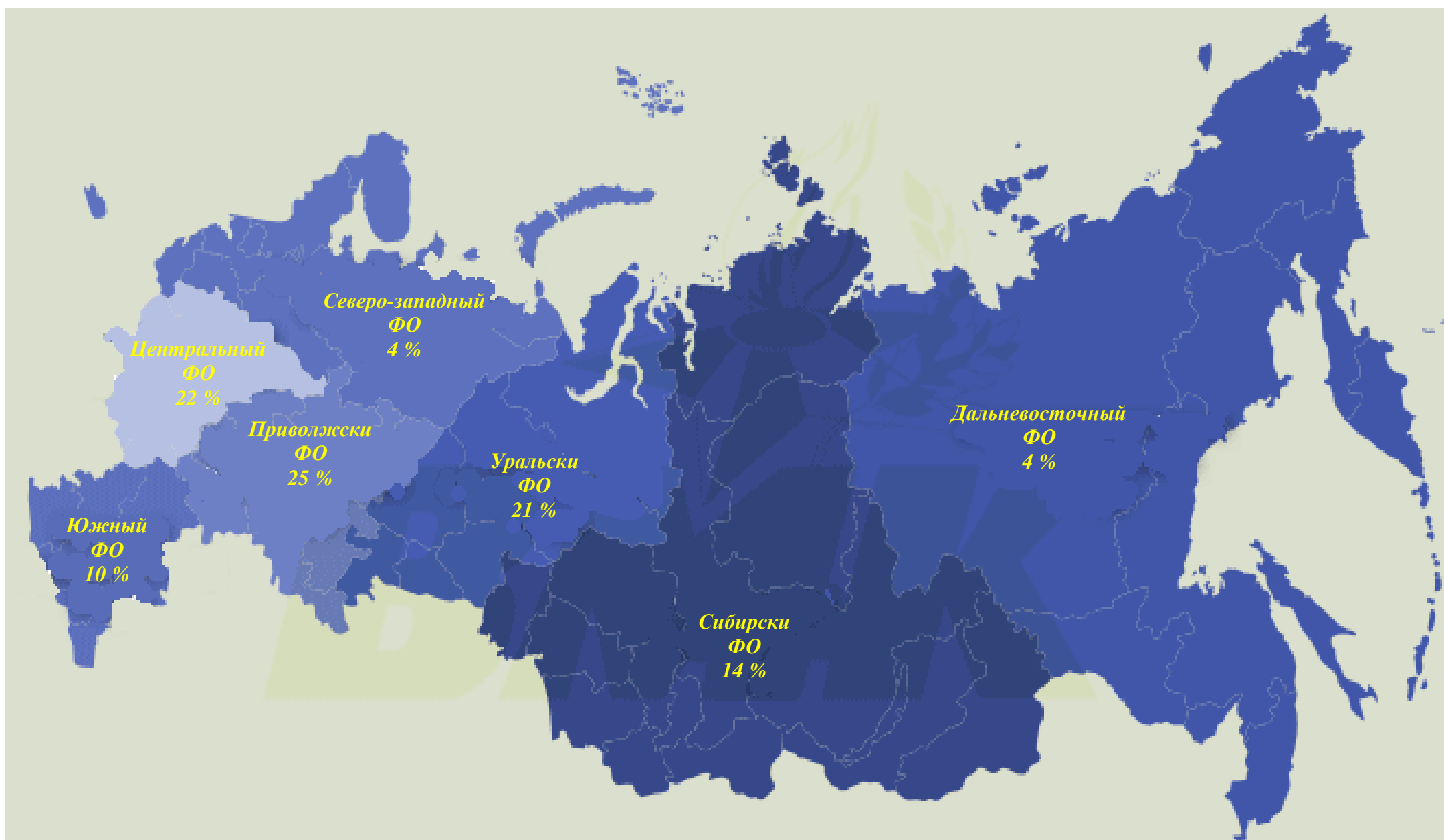
Реализация металлопродукции ОАО «БМК» по округам РФ в 2009 г.